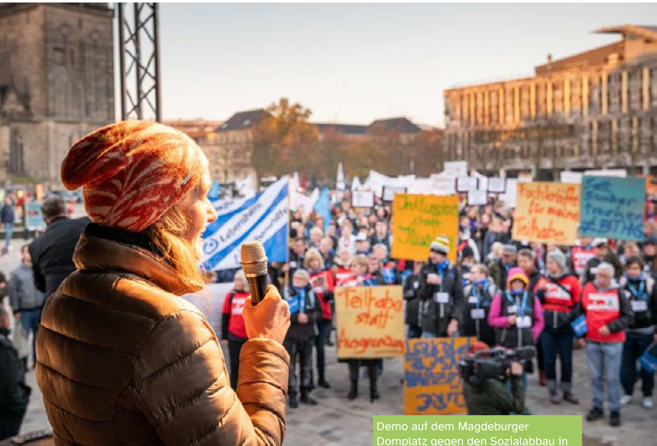
Demo auf dem Magdeburger Domplatz gegen den Sozialabbau in der Eingliederungshilfe

Ende des Jahres 2023 wurde der Landesrahmenvertrag für die Eingliederungshilfe durch das Land Sachsen-Anhalt einseitig gekündigt. In den darauffolgenden Verhandlungen für einen „neuen“ Landesrahmenvertrag konnte keine Einigung erzielt werden. Das war vor dem Hintergrund der zeitlichen Begrenzung von sechs Monaten sowie der vielen wichtigen Verhandlungspunkte und -themen, nicht zu erwarten. Im Herbst 2024 deutete sich eine Rechtsverordnung zum Ersatz eines Landesrahmenvertrages an.